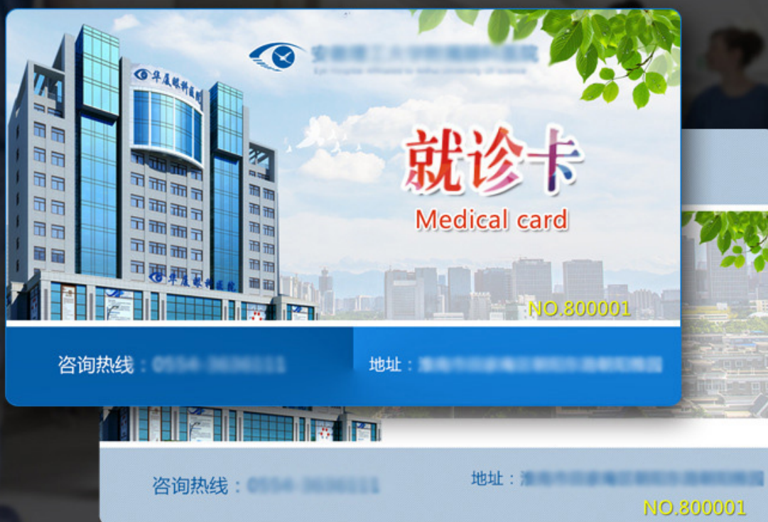
PVC芯片卡 医院就诊卡