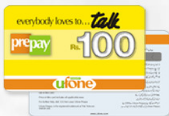
刮刮卡 SCRATCH CARD