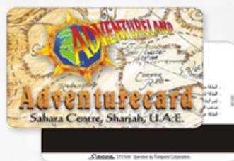
磁条卡 MAGNETIC STRIPE CARDS