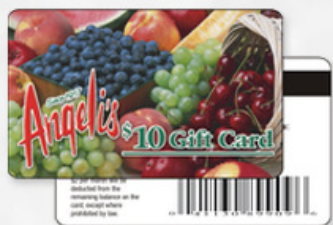
条码卡 BARCODE CARD