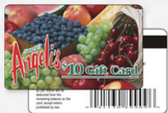
条码卡 BARCODE CARD