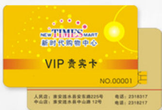
IC卡 IC CARD