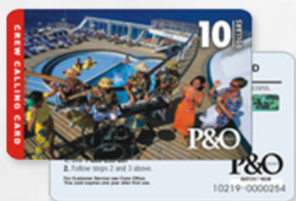
数据卡 DATA CARD

MULTIPLE MATERIALS, MULTIPLE PROCESSES WORRY-FREE CHOICE