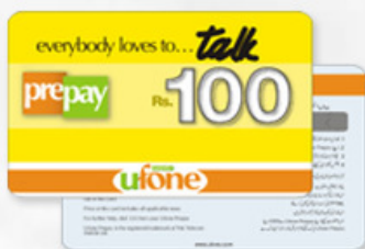
刮刮卡 SCRATCH CARD