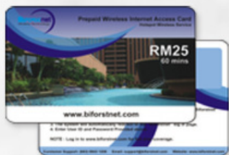
普通卡 REGULAR CARD