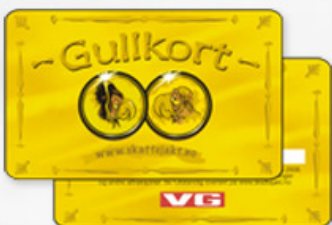
金银卡 GOLD AND SILVER CARDS