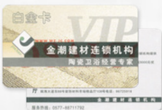
射频卡 RADIO FREQUENCY CARD