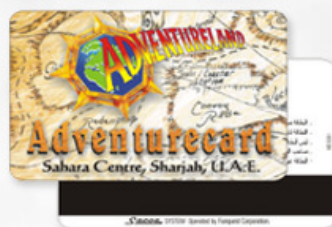
磁条卡 MAGNETIC STRIPE CARDS