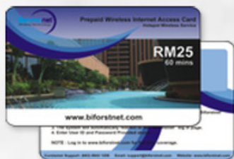
普通卡 REGULAR CARD