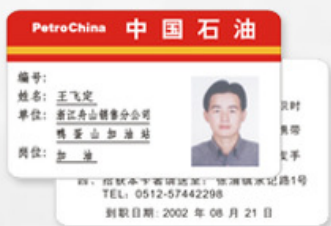
证像卡 ID CARD