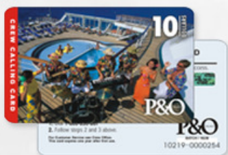
数据卡 DATA CARD

MULTIPLE MATERIALS, MULTIPLE PROCESSES WORRY-FREE CHOICE