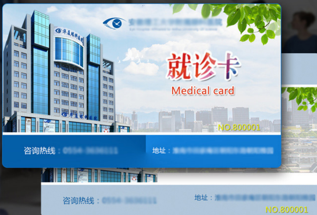
PVC芯片卡 医院就诊卡