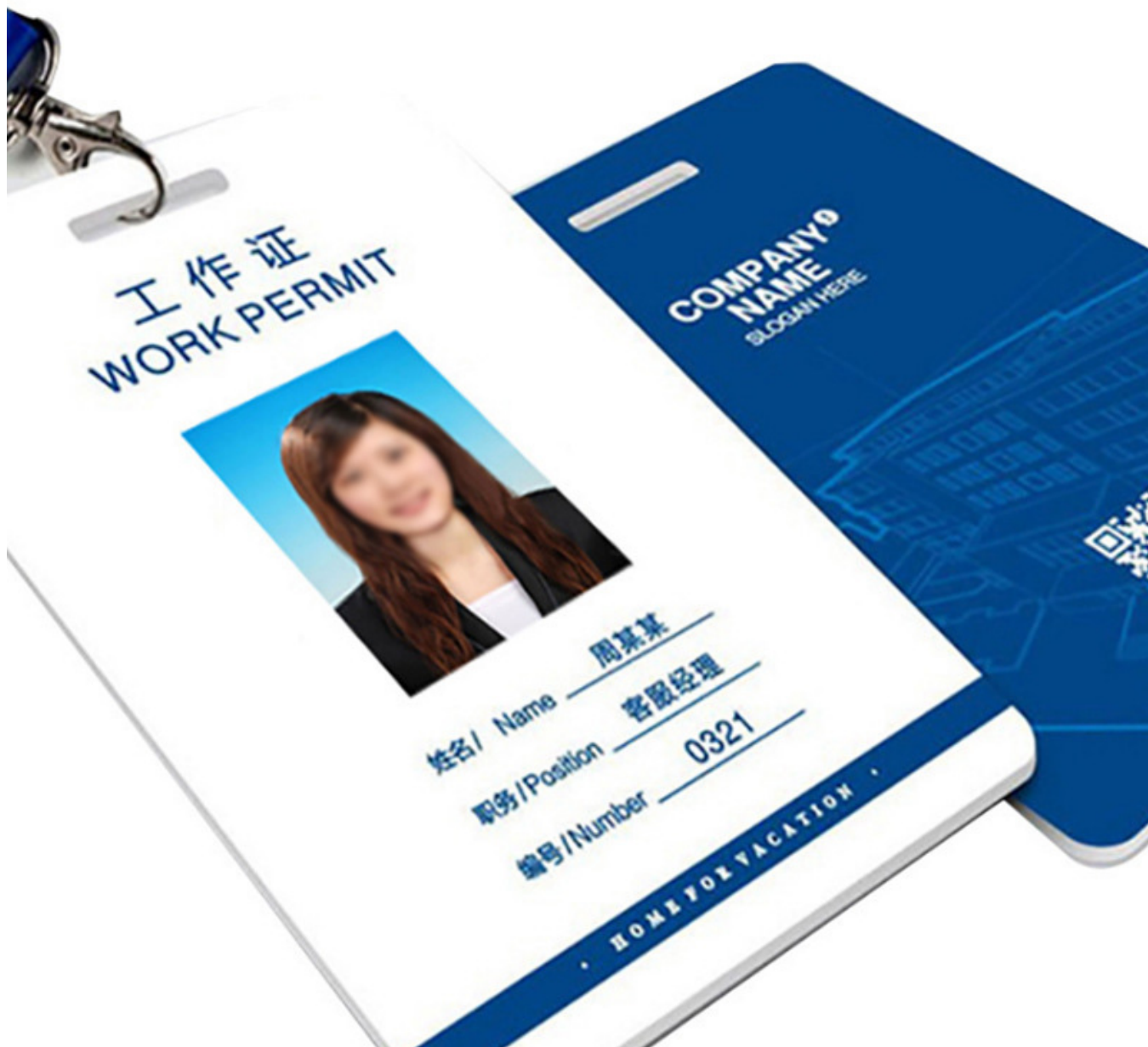
PVC证件卡 PVC礼品卡 提货卡 实体工厂 任意定制